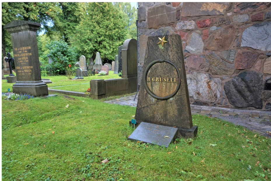
Kuva 1. Bernhard Crusellin hautakivi Solnan hautausmaalla.