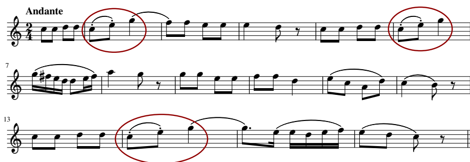
Kuva 4. Bernhard Crusellin teoksen Introduction et air suédois varié op. 12 teema eli Olof Åhlströmin säveltämä juomalaulu Goda gosse glaset tøm. Ympyröitynä melodian korostetut nousevat kolmen sävelen eleet.

taa tauoilla jaksotetut kolme sointua nousevine ylä-äänineen (kuva 2) – samankaltainen kolmi-idea kuullaan Crusellin c-molli-kvartetton op. 4 (Crusell S.A.) alussa (kuva 3), tosin mollissa ja laskevana.