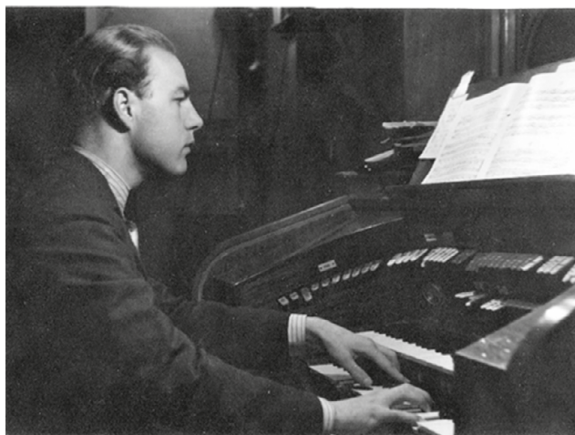
Bild 2. Organisten på 1930-talet i Drammen, Bragernes kirke. Privat samling