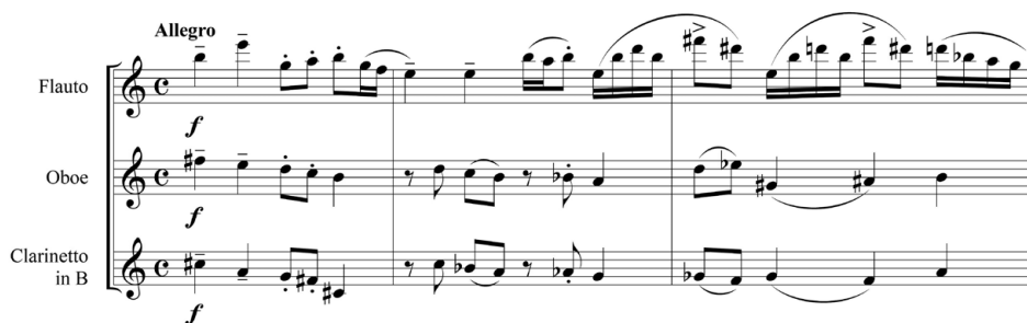
Bild 3. Trios distinkta huvudtema med en stigande kvart börjar i e-moll

Den år 1957 komponerade Trio för flöjt, oboe och klarinett (op. 44) är ett centralt exempel på Badens produktion och på norsk nyklassicism med sin tydliga struktur och textur. Verket uruppfördes vid de Nordiska Musikdagarna i Oslo 1958 och är publicerad av Lyche musikkforlag.